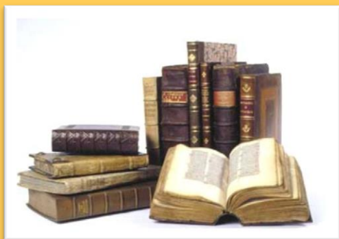
בית מדרש אתיקה