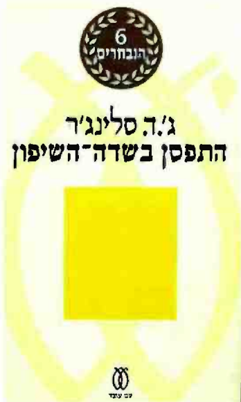
▶ המוצר המקורי שממנו מפיקים את השטנצים והגימיקים. "מדריך הטרמפיסט לגלקסיה", "שר הטבעות" ו"התפסן בשדה השיפון"