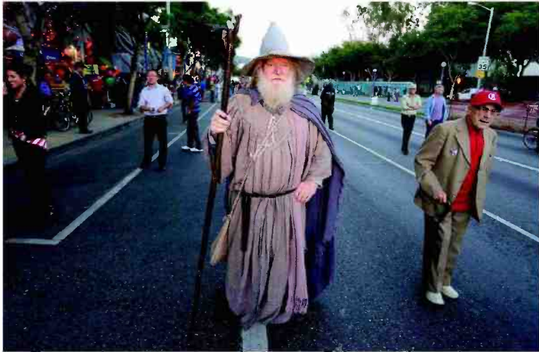
▶ "הערצה כזו יכולה להגיע עד שינויי גוף קיצוניים, אימוץ אורח חיים אלטרנטיבי או התאבדות". קונים ולהביא במכירת כרך חדש מסדרת "הארי פוטר" משמאל: איש מחופש לגנדלף מ"שר הטבעות"